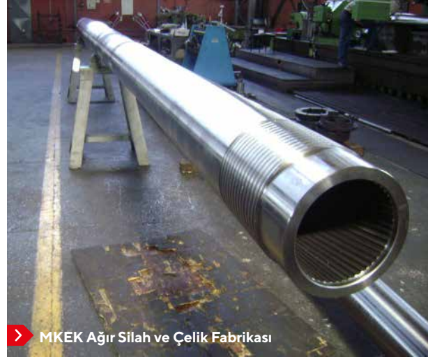
MKEK Ağır Silah ve Çelik Fabrikası