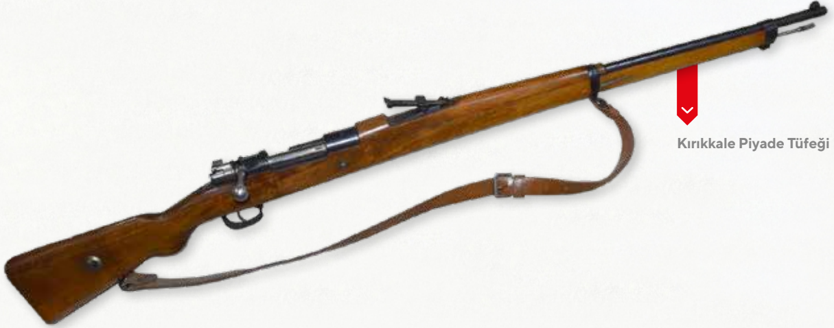
Kırıkkale Piyade Tüfeği