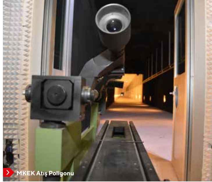
> MKEK Atış Poligonu