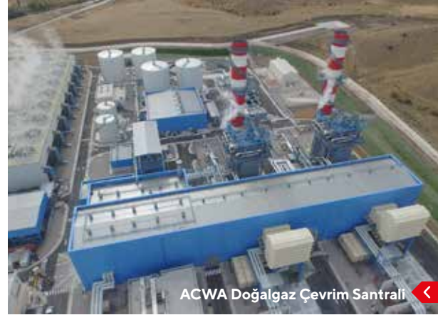
ACWA Doğalgaz Çevrim Santrali

501 km'lik Mavi Akım Doğalgaz Boru Hattı'nın 96 km'lik kısmı, 1.105 km'lik İran-Türkiye Doğalgaz Boru Hattı'nın 29 km'lik kısmı ile Trans Anadolu Doğalgaz Boru Hattı (TANAP)'nin 63 km'lik kısmı Kırıkkale il sınırlarından geçmektedir.