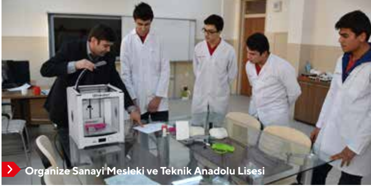
Organize Sanayi Mesleki ve Teknik Anadolu Lisesi

Kırıkkale'nin kuruluş sebebi olan MKEK fabrikaları hiçbir zaman sadece belli ürünleri imal eden kuruluşlar olmamış aynı zamanda başta savunma sanayi olmak üzere pek çok sektöre kalifiye işgücü yetiştiren okul olma misyonunu da üstlenmiştir. MKEK fabrikalarından emekli olan veya ayrılan teknik personeller yine savunma sanayi alanında faaliyetlerini sürdürmüşlerdir.