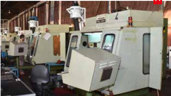
MKEK Silah Fabrikası

Kırıkkale il merkezinde sanayi yatırımları ağırlıklı olup, ilçeler ve kırsal kesimin ekonomisi ise tarım ve hayvancılığa dayalıdır. Kentteki imalat sanayi kamuya ait büyük işletmelerin yanı sıra özel sektöre ait küçük ve orta ölçekli işletmelerden oluşmaktadır.