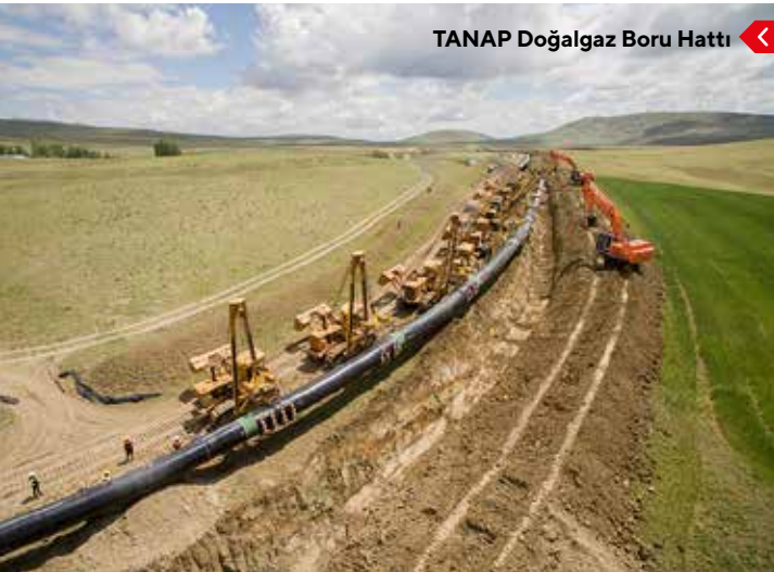
TANAP Doğalgaz Boru Hattı